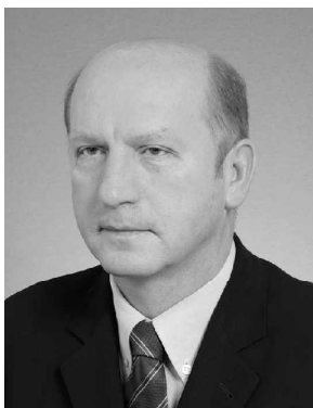
A. Maciej Płażyński

Historyk. Uczestnik Duszpasterstwa Akademickiego, w latach 1977–1979 uczestnik Ruchu Obrony Praw Człowieka i Obywatela (ROPCiO), od 1978 roku, redaktor „Bratniaka”, współzałożyciel Ruchu Młodej Polski (RMP). Współwykonawca spisanego na tablicach 21 postulatów strajkowych. Internowany 13 grudnia 1981 roku. W latach 1983–1988 sekretarz Lecha Wałęsy. Zginął w katastrofie lotniczej 10 kwietnia 2010 roku, towarzysząc Prezydentowi RP, Lechowi Kaczyńskiemu w podróży do Katynia.